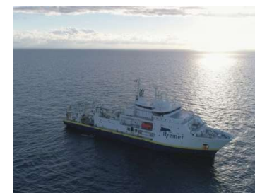
N/O Pourquoi pas?