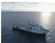
Pourquoi pas ?