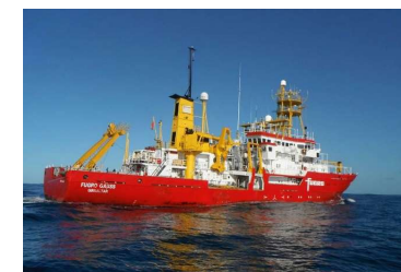
Navire Gauss (Fugro)