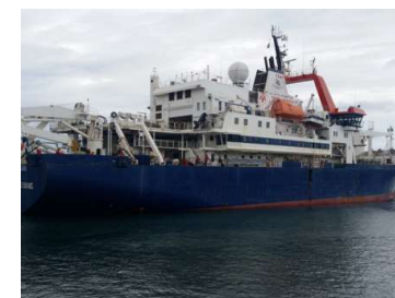
N/O Marion Dufresne