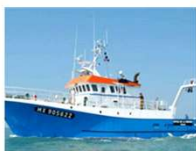
Côtes de la Manche