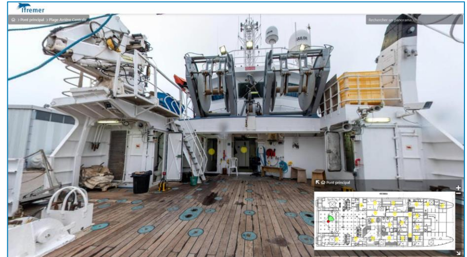
L'Europe SBS interactive Vis-On